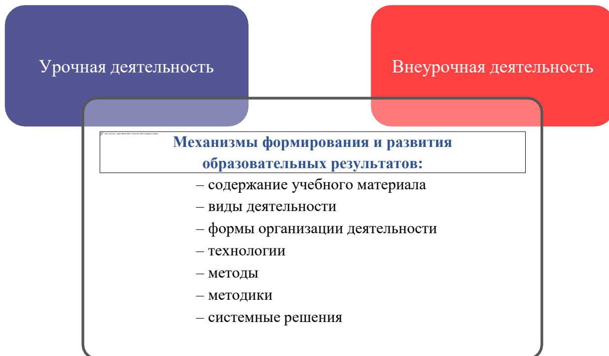
Рис. 1. Механизмы формирования и развития образовательных результатов

Характеристика личностных, метапредметных и предметных результатов отражена в рабочих программах по предметам, курсам, модулям, в том числе внеурочной деятельности.